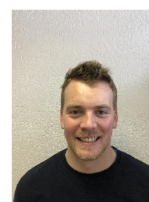
Christophe Von Däniken